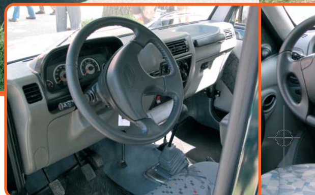
A beltér harmonizál a külsővel. A Bolero műszerfala egyszerűbb, szögletesebb, míg a Goáé igényesebb, lágyabb vonalvezetésű és több extrát kínál

Jelenleg országszerte 17 partnerrel együttműködve összesen 18 értékesítési és szervizpont várja a Mahindra ügyfeleit. A gyártó két év kilométer-korlátozás nélküli teljes körű, míg a fődarabokra három év garanciát vállal.