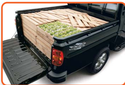
A Mahindra pickupok platójának mérete és terhelhetősége összhangban áll a kategóriatársakéval

nem zárták a görög összeszerelő üzemet. A típust történetesen a balatonfüredi Globe-Carex Kft. forgalmazta, amely a '90-es évek elejétől több autó- és motorkerékpár-márka hivatalos importőréként tevékenykedik, mígnem tavaly év végén ismét felvették a Mahindrát a palettára.